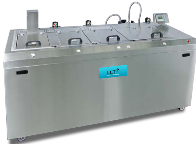
Zellenreinigungsanlage als Sonderanfertigung